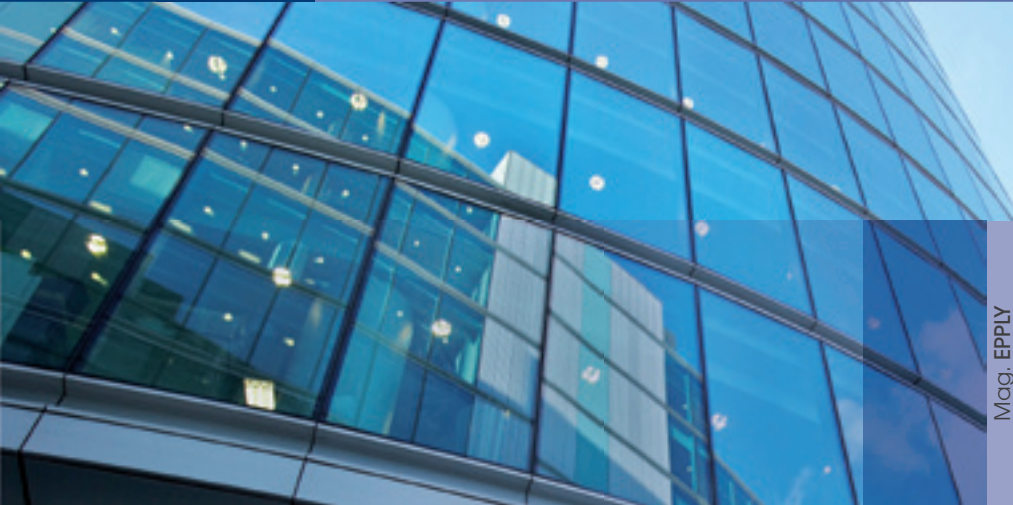
Mag. EPPLY Finanzverwaltung